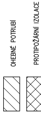
DOKUMENTACE SKUTEČNÉHO PROVEDENÍ

PŘESNÁ SPECIFIKACE ZÁŘÍZENÍ JE SOUČÁSTÍ TECHNICKÉ ZPRÁVY